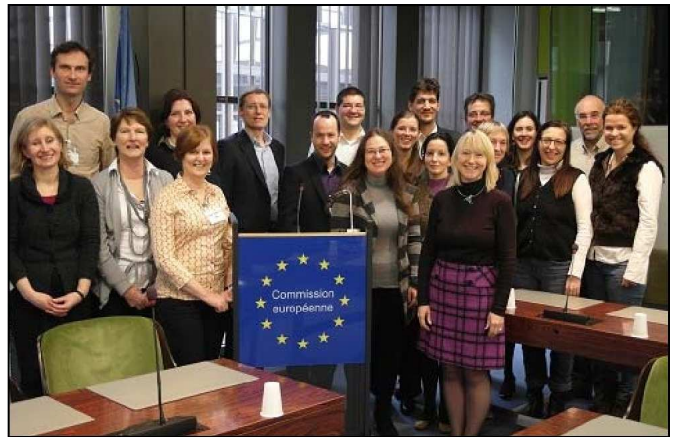
PREDI-NU konsortsium teisel projekti koosolekul Euroopa Komisjonis Luxembourgis, veebruar 2012